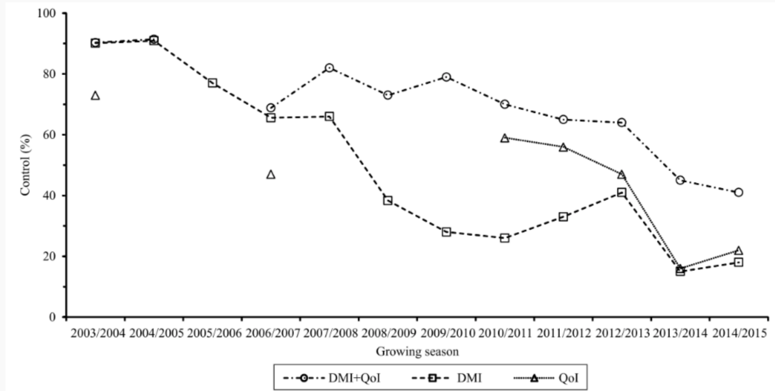
Pérdida de eficacia (en %) por fungicida por zafra anual (Mercado Brasileiro)

la roya asiática puede causar perdidas de rendimiento de hasta 90%.